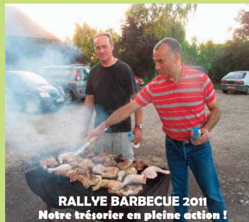
RALLYE BARBECUE 2011 Notre trésorier en pleine action !